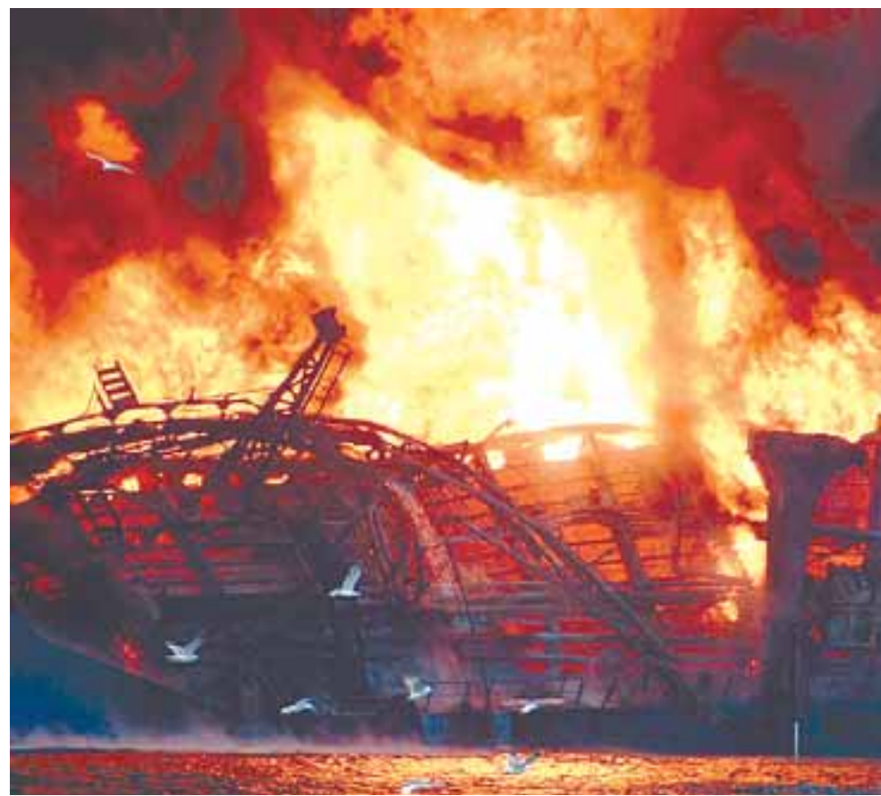
Nel servizio fotografico quattro drammatiche immagini della Panam Serena devastata dalle fiamme